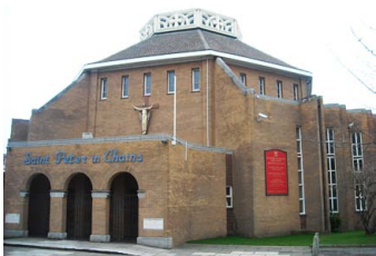
St Peter in Chains